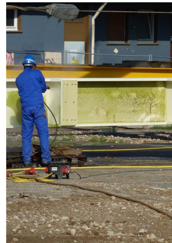
Hochdruckreinigung der Stahlträger