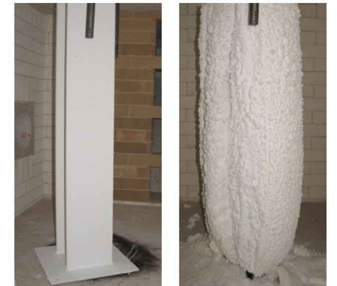
Abb. links: Beschichteter Probekörper vor dem Brand Abb. rechts: Aufgeschäumter Probekörper nach dem Brand