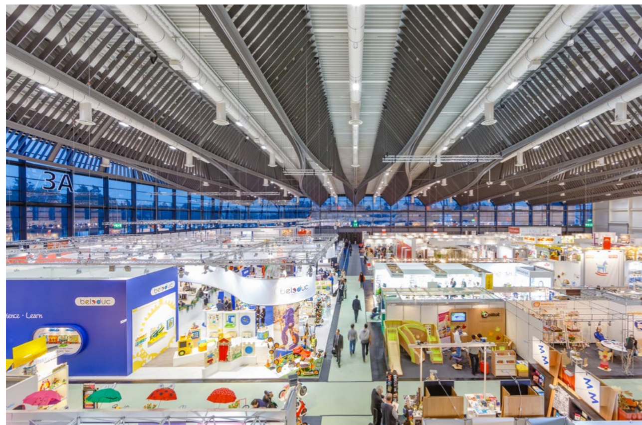
Messehalle 3a, Innenansicht

Die hohen Anforderungen an den Brandschutz werden mit FIRETEX® Platinum-120 erreicht. Fast 300 Tonnen der neusten Brandschutztechnologie sind eingesetzt worden. Damit gelingt es, die Evakuationszeit im Brandfall deutlich zu verlängern und die Bauzeit kurz zu halten. Denn der Zeitplan war ambitioniert und die Konstruktion musste im Winter errichtet werden.